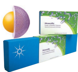
AdvanceBio 氨基酸分析 LC/UV