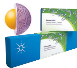
AdvanceBio MS Spent Media LC/MS