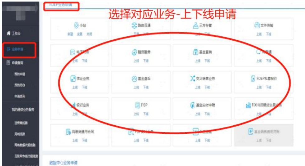
(业务申请界面示意图)