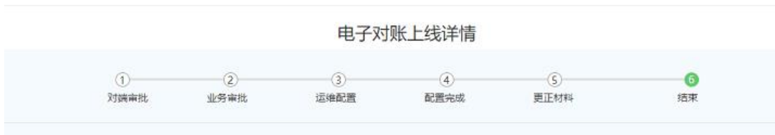
(关系对申请流程图)