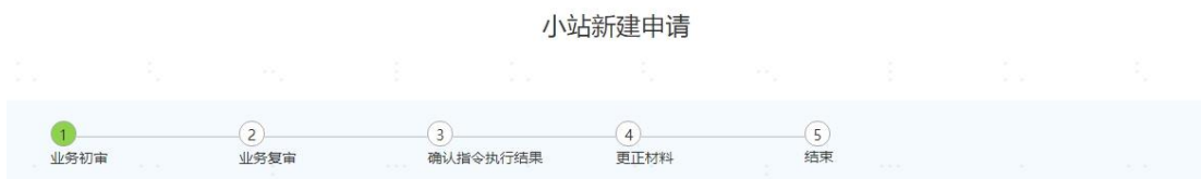
(小站-新建 业务申请流程图)