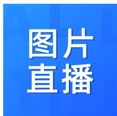
分享到微信朋友圈会显示封面